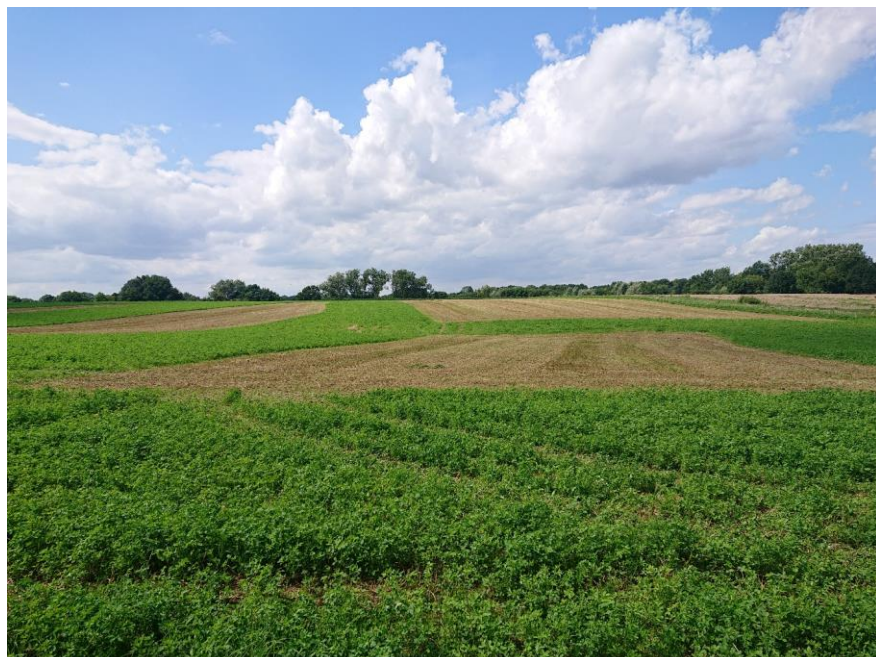
Juist gefaseerd gemaide luzerne

Luzernepercelen worden rond februari volledig geklepeld om gelijkmatig uitlopen van het gewas in het voorjaar te stimuleren.