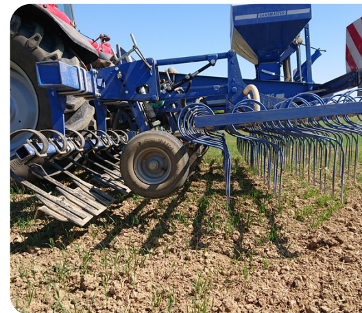
Slim toepassen van de verschillende hamstervriendelijke gewassen om veronkruiding binnen de perken te houden. Zoals de mengteelt die bestaat uit een onderzaai van klaver (Rik Schreurs)

“Met het toepassen van een meer collectieve gedachte om veronkruiding aan te pakken binnen het hamsterbeheer, kunnen we nog enorme stappen maken. De kwaliteitsslag die we met z'n allen moeten maken binnen het hamsterbeheer staat stil. Daarom blijven dezelfde problemen zich voordoen.