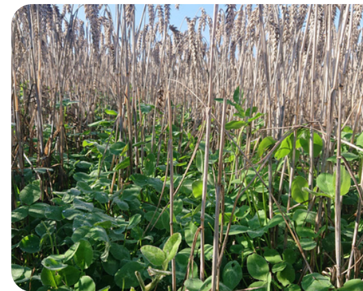
Onderzaai van klaver in granen om veronkruiding tegen te gaan, biedt ook goede dekking en voedsel