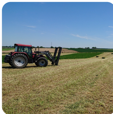
Hoe kan de hamster de landbouw de weg kan wijzen om deze economisch en maatschappelijk van hoge waarde te houden (Rik Schreurs)