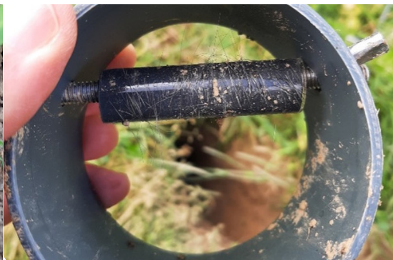
Een haarval in een van de pijpen van een hamsterburcht (links) en succesvolle verzameling van haren op het 'rolletje' met dubbelzijdig plakband (rechts).